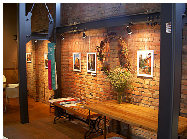
れんが壁面のパネル展示

アンテナショップでは、グレシャム市のFM局(KMHD)からの音楽が、インターネット経由でライブで流れております。また、2000年からスタートした経済交流の成果として、グレシャム市にあるボイドコーヒー社のコーヒー等がお楽しみいただけます。