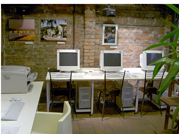
パソコンコーナー