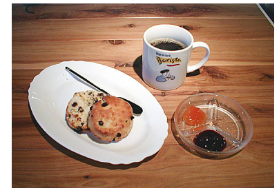
コーヒーやスコーンなどもあります