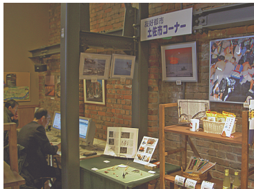
友好都市土佐市コーナー