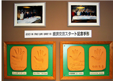
経済交流スタートの記念手形

江別グレシャムアンテナショップは、江別市の産業遺産であり、まちのシンボルの存在であるれんが工場の一部を利用して作られました。まちの歴史的建造物の保存活用事例を、グレシャム近郊の「エッジフィールド」に学ぼうとしております。(古いレンガ建物を改修して、ホテル、レストラン、パブ、シアターなどとして活用中)。