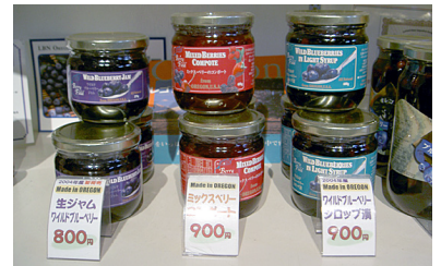
オレゴン州産のジャム販売

アンテナショップは、様々な情報の交換の場として、江別市民、グレシャム市民、及び両市の企業・団体のどなたでも利用できます。ショップでは、主にグレシャム市のくらし、文化、経済情報を写真、ビデオ、印刷物、展示物、インターネットなどを使って提供して行きます。