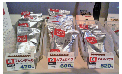
ボイド社のコーヒー販売